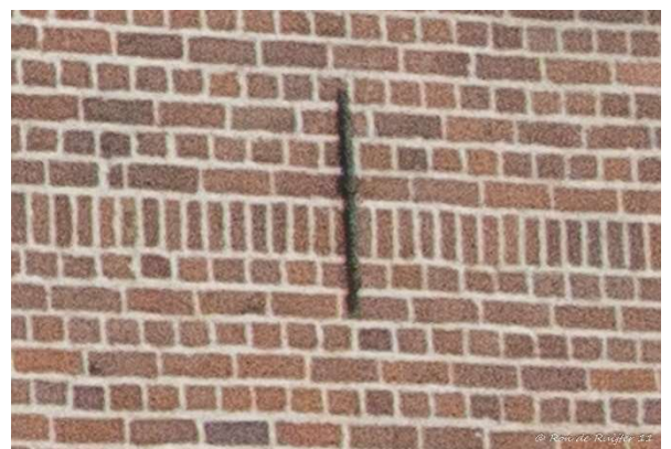
Foto rechts: de verticale gemetselde rij stenen en een muuranker in de gevel van Molenstraat 18 (voor hernummering).