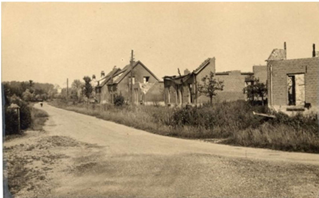
Foto: De Molenstraat gezien vanaf de Hoofdstraat zoals Heintje en Nelis deze na de oorlog aantreffen. 7