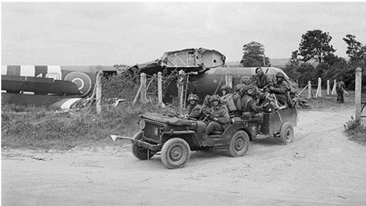
Foto: Inhoud van één van de zweefvliegtuigen zoals de bewoners van de Molenstraat gezien kunnen hebben. 4